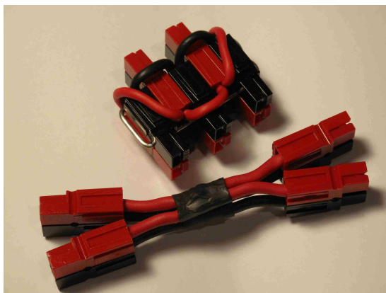
Figure 6 : Prises multiples construites avec des connecteurs Powerpole. -- Bloc de 5 prises attachées par leur queue d'aronde -- Bloc de 4 prises sur fils.

Vous trouvez de nombreux types d'adaptateur permettant de passer du système Powerpole aux autres systèmes et inversement (prise allume cigare, connecteur Molex, connecteurs en T, etc) (Figure 7) [3]. L'absence de genre des Powerpole simplifie les adaptations. Les adaptateurs du commerce sont relativement chers, mais un bon radioamateur équipé d'un fer à souder doit être capable de les construire lui-même. Il existe même des petits boîtiers qui s'insèrent entre 2 connecteurs pour mesurer la tension, le courant et la puissance (Figure 8).