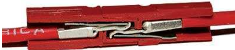
Figure 3 : Vue en coupe montrant les contacts et les ressorts assurant la pression de contact

La conception de ces connecteurs est assez astucieuse ; elle est protégée par brevet. Le contact se fait entre des lames plates maintenues par ressort (Figure 3). Le ressort sert à la fois au maintien en place de la tête du contact et à créer la pression de contact.