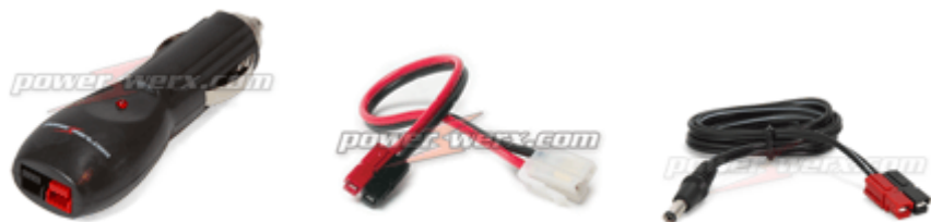
Figure 7 : Adaptateurs Powerpole Prise allume-cigares Prise en « T » Prise coaxiale

Vous trouvez de nombreux types d'adaptateur permettant de passer du système Powerpole aux autres systèmes et inversement (prise allume cigare, connecteur Molex, connecteurs en T, etc) (Figure 7) [3]. L'absence de genre des Powerpole simplifie les adaptations. Les adaptateurs du commerce sont relativement chers, mais un bon radioamateur équipé d'un fer à souder doit être capable de les construire lui-même. Il existe même des petits boîtiers qui s'insèrent entre 2 connecteurs pour mesurer la tension, le courant et la puissance (Figure 8).