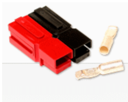
Figure 1 : Les composants des connecteurs Powerpole : les 2 supports rouge et noir et les 2 contacts

Ayant eu entre les mains un lot de ces connecteurs, nous avons pu apprécier leurs très grandes qualités. Ils vont certainement devenir un système de connexion assez universel pour nos activités.