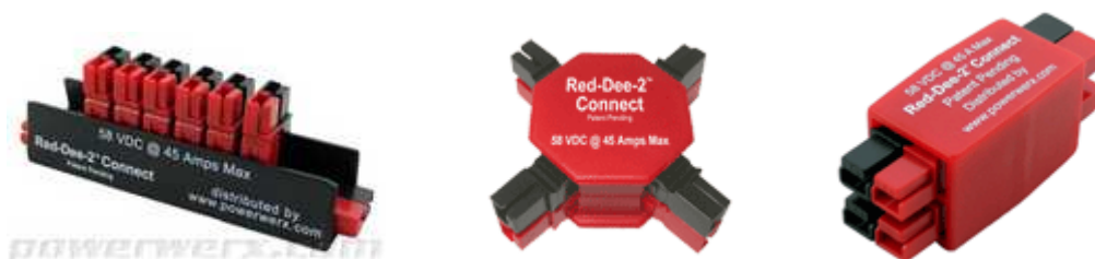
Figure 5 : Prises multiples : alignées en croix opposées