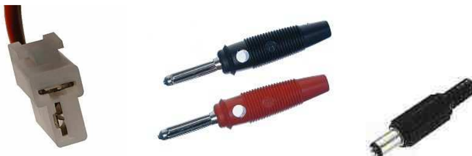
Figure 2 : Connecteur en « T » Fiches « Banane » Connecteur coaxial

Actuellement, les connecteurs de nos émetteurs-récepteurs et de différents appareils sont assez variés. Les émetteurs VHF ou UHF utilisent souvent des connecteurs en « T » (Figure 2). Pour la quinzaine d'ampères consommés, ça fonctionne correctement. Les émetteurs décamétriques sont généralement équipés de connecteurs à plusieurs contacts pour le +12V et la masse. Quant aux multiples appareils à plus faible consommation, ils ont leur propre connectique, souvent coaxiale, qu'il faut adapter à la bonne tension.