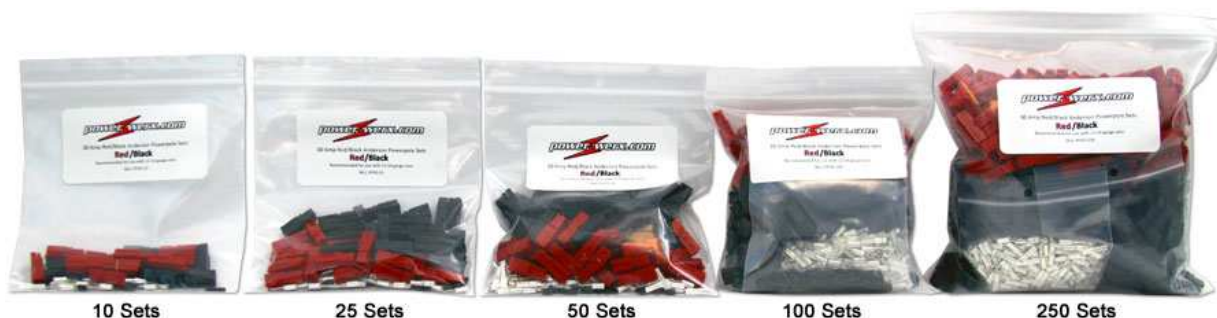
Figure 9 : Conditionnement des connecteurs Powerpole, par sachets de 10, 25, 50, 100 ou 250 paires « noir + rouge »

En Europe, nous avons vu ces connecteurs sur le site internet de WIMO [4], par sachet de 12.