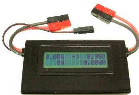
Figure 8 : Système de mesure de tension, de courant et de puissance qui s'insère dans une ligne équipée de connecteurs Powerpole

Pour alimenter un émetteur décamétrique ou un amplificateur, si les 45 ampères des contacts ne vous suffisent pas, vous pouvez en mettre plusieurs en parallèle. Vous pouvez aussi passer au standard Powerpole plus gros (75A), mais vous perdez alors l'universalité des connecteurs 15-30-45A.